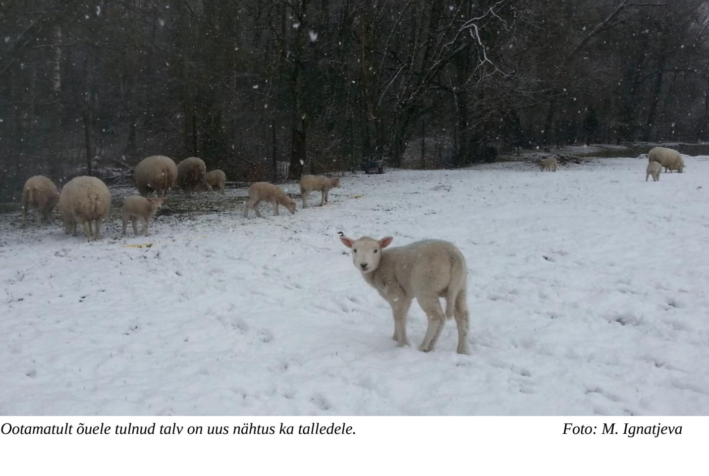
Ootamatult õuele tulnud talv on uus nähtus ka talledele.

Eesti Lamba- ja Kitsekasvatajate Liidu tegevjuht