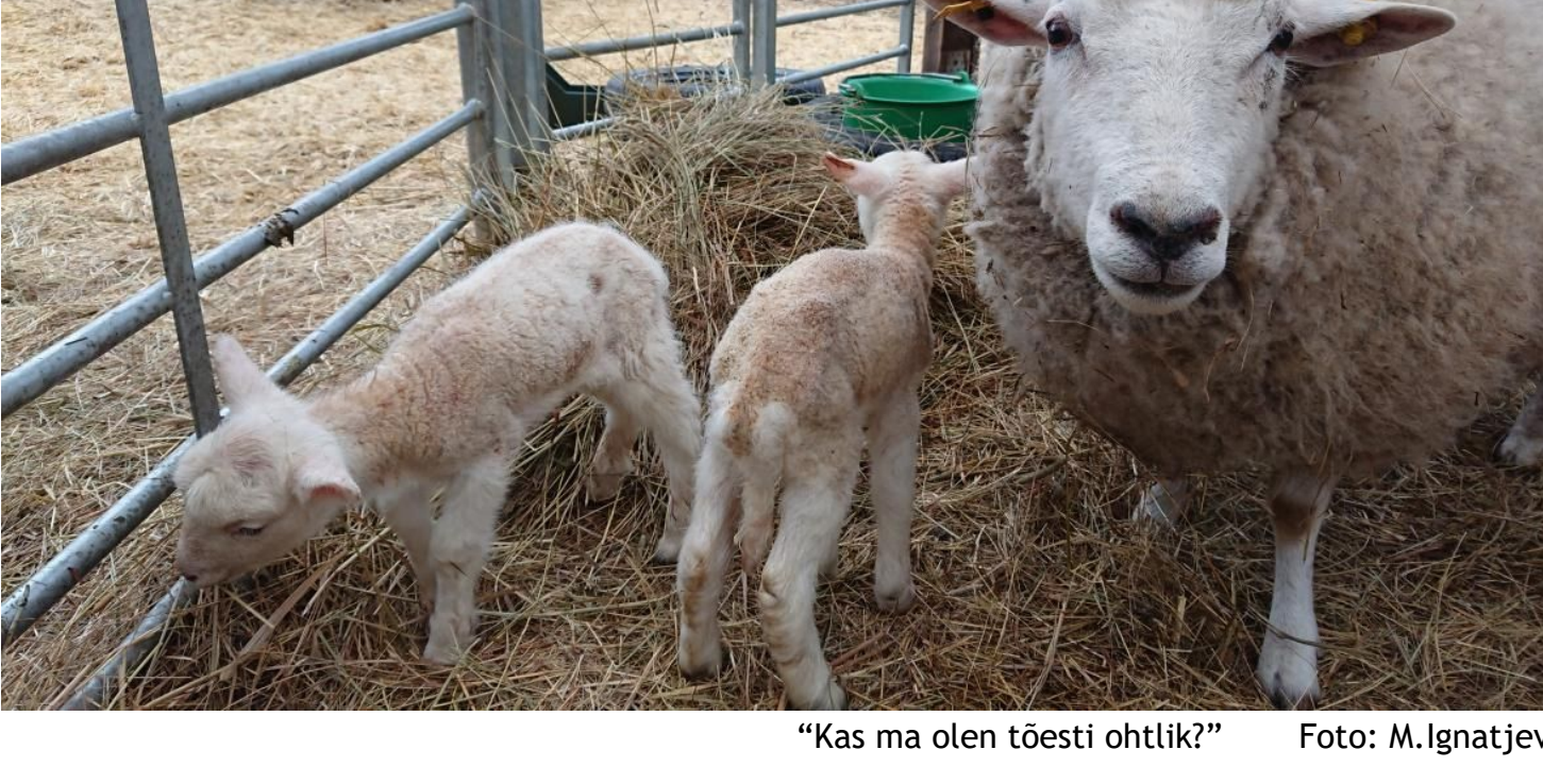
"Kas ma olen tõesti ohtlik?"